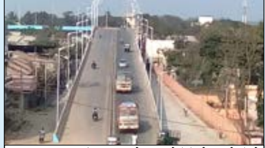
ಎ.ಪಿ.ಎಂ.ಸಿ. ಬಳಿ ರೂ.28.00 ಕೋಟಿ ವೆಚ್ಚದ ಮೇಲುಸೇತುವೆ.