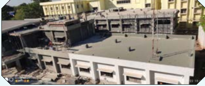
ರೂ. 15 ಕೋಟಿ ವೆಚ್ಚದ ನಿಟ್ಟುವಳ್ಳಿ ಇ.ಎಸ್.ಐ. ಆಸ್ಪತ್ರೆ ಕಟ್ಟಡ.