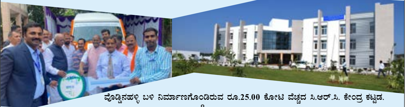
ವೌಡ್ಡಿನಹಳ್ಳಿ ಬಳಿ ನಿರ್ಮಾಣಗೊಂಡಿರುವ ರೂ.25.00 ಕೋಟಿ ವೆಚ್ಚದ ಸಿ.ಆರ್.ಸಿ. ಕೇಂದ್ರ ಕಟ್ಟಡ.