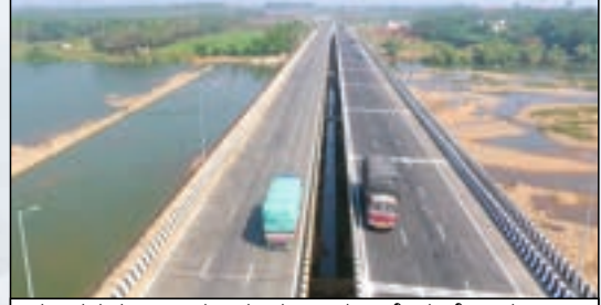
ಹರಿಹರದ ಬಳಿ ತುಂಗ ಭದ್ರಾ ನದಿ ಸೇತುವೆ ನಿರ್ಮಾಣ.

★ ದಾವಣಗೆರೆ-ಚನ್ನಗಿರಿ ರಾಜ್ಯ ಹೆದ್ದಾರಿಯನ್ನು ರಾಷ್ಟ್ರೀಯ ಹೆದ್ದಾರಿಯನ್ನಾಗಿ ಮೇಲ್ದರ್ಜೆಗೇರಿಸಿ ತಾತ್ಕಿಕ ಅನುಮೋದನೆ (In Principle) ನೀಡಲಾಗಿದ್ದು, ಅಭಿವೃದ್ಧಿಪಡಿಸಲು ಸಮಗ್ರ ಯೋಜನಾ ವರದಿ ಸಲ್ಲಿಸಿದೆ.