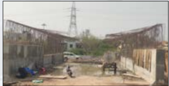
ದಾವಣಗೆರೆ ಬನಶಂಕರಿ ಬಡಾವಣೆ ಸೇತುವೆ.