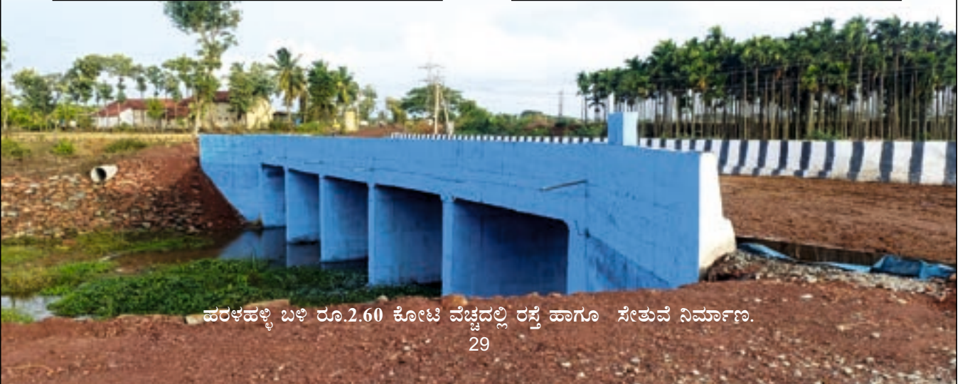
ಹರಳಹಳ್ಳಿ ಬಳಿ ರೂ.2.60 ಕೋಟಿ ವೆಚ್ಚದಲ್ಲಿ ರಸ್ತೆ ಹಾಗೂ ಸೇತುವೆ ನಿರ್ಮಾಣ.