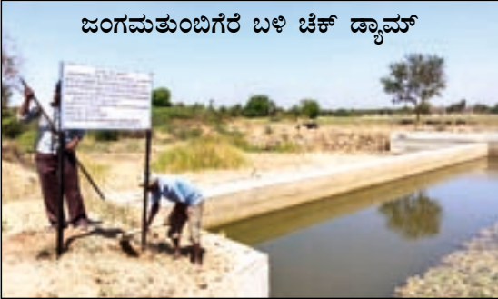
ಜಂಗಮತುಂಬಿಗರೆ ಬಳಿ ಚಿಕ್ ಡ್ಯಾಮ್