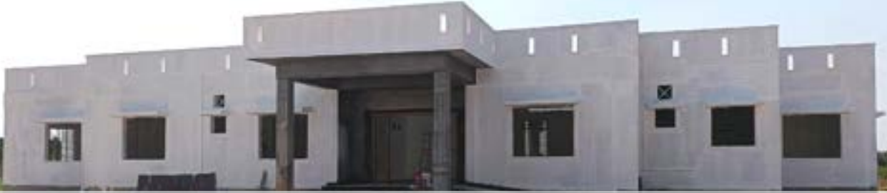
ದಾವಣಗೆರೆ ನಗರದ ಮೊರಾರ್ಜಿ ದೇಸಾಯಿ ಮಾದರಿ ವಸತಿ ಶಾಲೆ ಕಟ್ಟಡ.