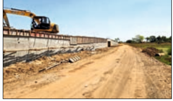
ಸಂಕ್ಲೀಪುರ ಬಳಿ ರೂ.8.00 ಕೋಟಿ ಮೊತ್ತದ ರಸ್ತೆ ಹಾಗೂ ಸೇತುವೆ ಕಾಮಗಾರಿ.