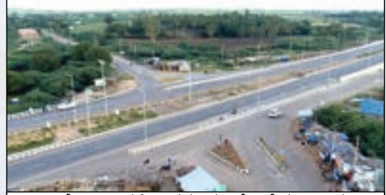
ಎನ್.ಹೆಚ್.13 ರಲ್ಲಿ ಜಗಳೂರು ದೊಣ್ಣೆಹಳ್ಳಿ ಜಂಕ್ಷನ್.