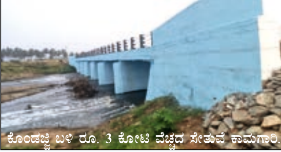
ಕೊಂಡಜ್ಜಿ ಬಳಿ ರೂ. 3 ಕೋಟಿ ವೆಚ್ಚದ ಸೇತುವೆ ಕಾಮಗಾರಿ.