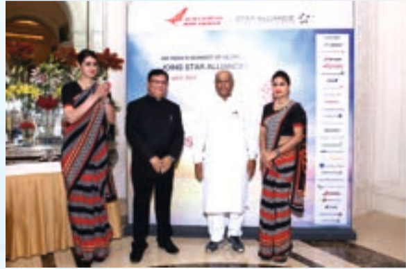
ಕೇಂದ್ರ, ಸಚಿವರಾಗಿ ಜಿ.ಎಂ. ಸಿದ್ದೇಶ್ವರ